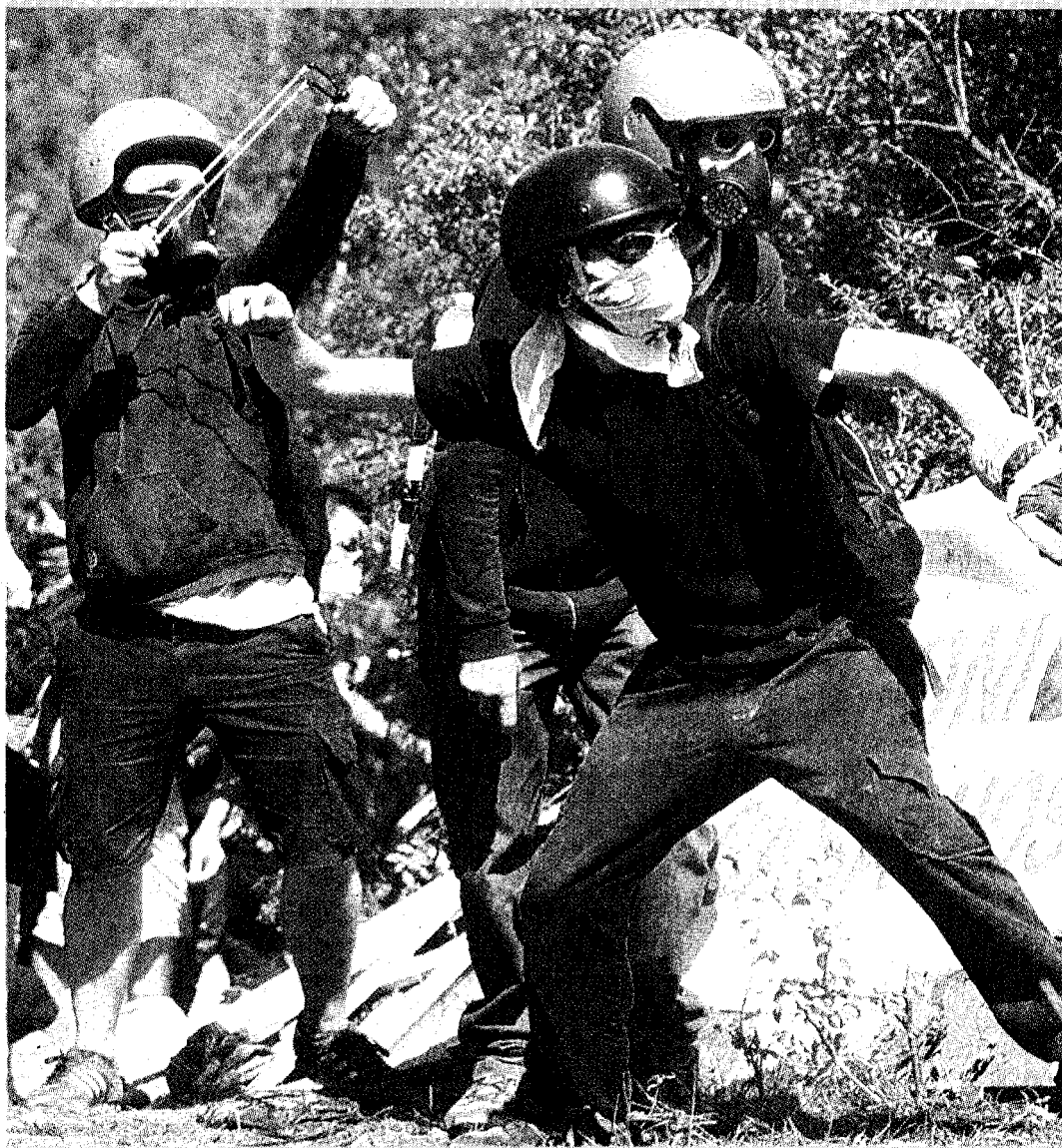
VIOLENZA Alcuni black bloc in azione in Piemonte: la Questura ha parlato di «azione terroristica»